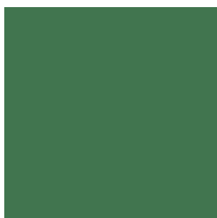
0059 Dark Green NT

6 mm.4100x1854mm 8 mm 4100x1854mm 8 mm 2800x1300mm