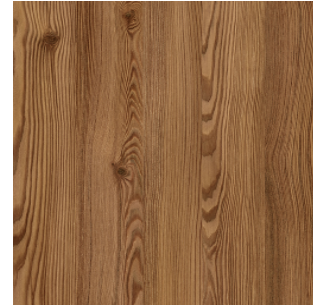
0927 Creek NT