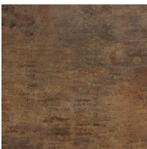
0794-Patina Bronze NT

6 mm.4100x1854mm 8 mm 4100x1854mm 8 mm 2800x1300mm