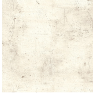
0426 Loft NT

6 mm 4100x1854 mm 8 mm 4100x1854 mm 8 mm 2800x1300 mm