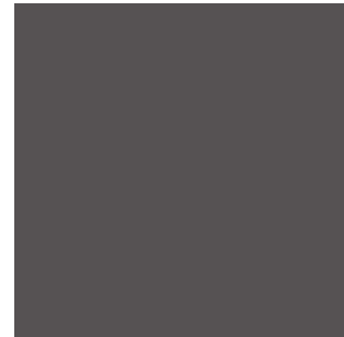
0077 Charcoal NT

6 mm 4100x1854 mm 8 mm 4100x1854 mm 8 mm 2800x1300 mm